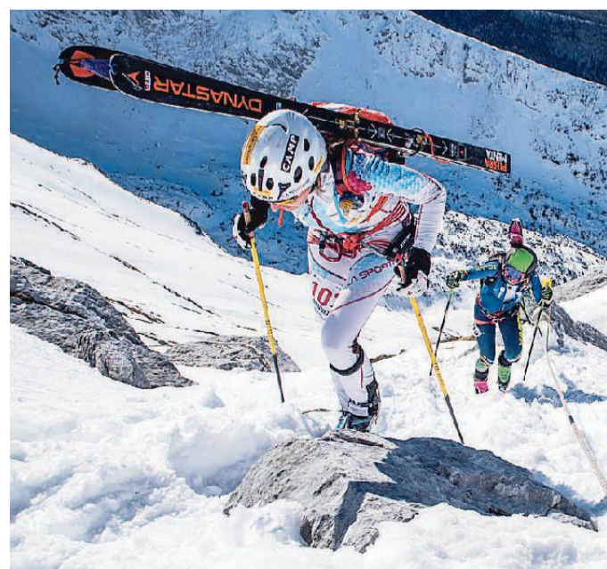
A febbraio torna un classico dello sci alpinismo, la Transcavallo

Coppa del mondo 2016. Nel dettaglio: la prima tappa si correrà venerdì 14, nel pomeriggio, con circa 1.000 metri di dislivello, partenza in Alpage e arrivo all'imbrunire a Piancavallo, con la salita all'inedita vetta del Monte Forcella. La seconda tappa riporterà gli atleti in Alpage, si rientrerà seguendo il tracciato della prova Vertical mondiale passando l'ardita Forcella di Palantina alta per tornare in Veneto, si salirà